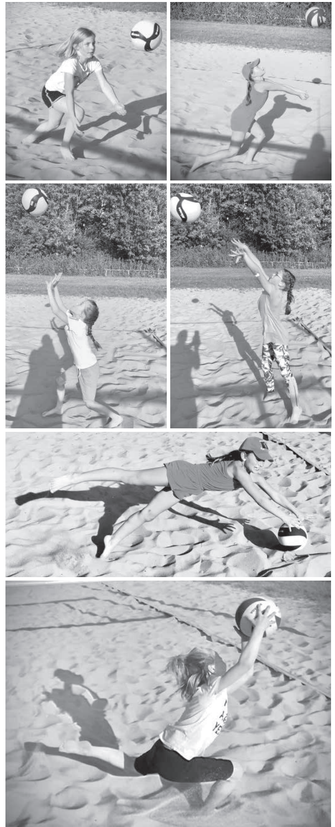
Erste spielerische Kontakte mit dem Volleyballsport auf dem ungewohnten Untergrund Sand.

kapazitäten über den Sommer knapp waren, fanden die ersten Kontakte mit dem neuen Spielgerät auf den Beachvolleyballplätzen des TSV statt.